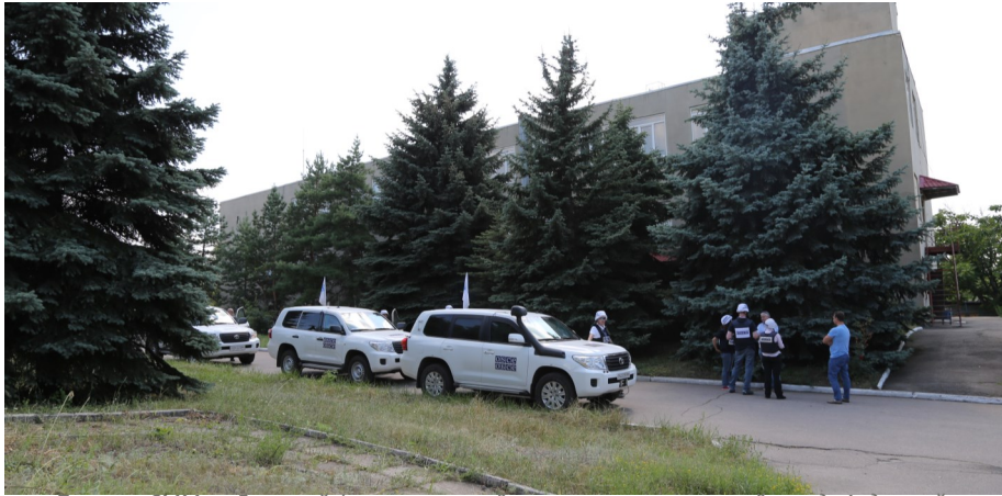
Патруль СММ на Донецкой фильтровальной станции, расположенной между Авдеевкой и Ясиноватой, 21 июля 2017