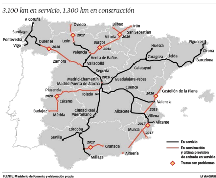
Figura 2. Trazado de la LAV en España. Situación actual y previsiones

Y no se está hablando de un tema menor. Por su impacto directo e inducido y por el volumen de recursos que moviliza, se puede considerar la “cuestión” de la AV como uno de los temas geopolíticos más claros y determinantes del Estado en las últimas décadas. En torno a ella se definen relaciones centro-periferia, lógicas radiales en detrimento de una concepción en red, el papel de las élites políticas y económicas, la integración en las grandes estrategias territoriales continentales y sus ejes ferroviarios y visiones sobre la organización territorial. La sucesión de cuatro planes de infraestructuras en 30 años pone de manifiesto tanto la importancia del tema como el elevado componente de discrecionalidad con la que se gestiona, siempre atentos a cambios de gobierno, de ministros, de alianzas, ... (Libourel, 2016; Cruz Villalón, 2017).