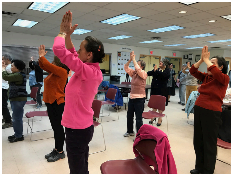
DFTA委員會科爾特斯·瓦茲奎茲參觀了埃爾姆赫斯特·傑克遜高地老齡中心。