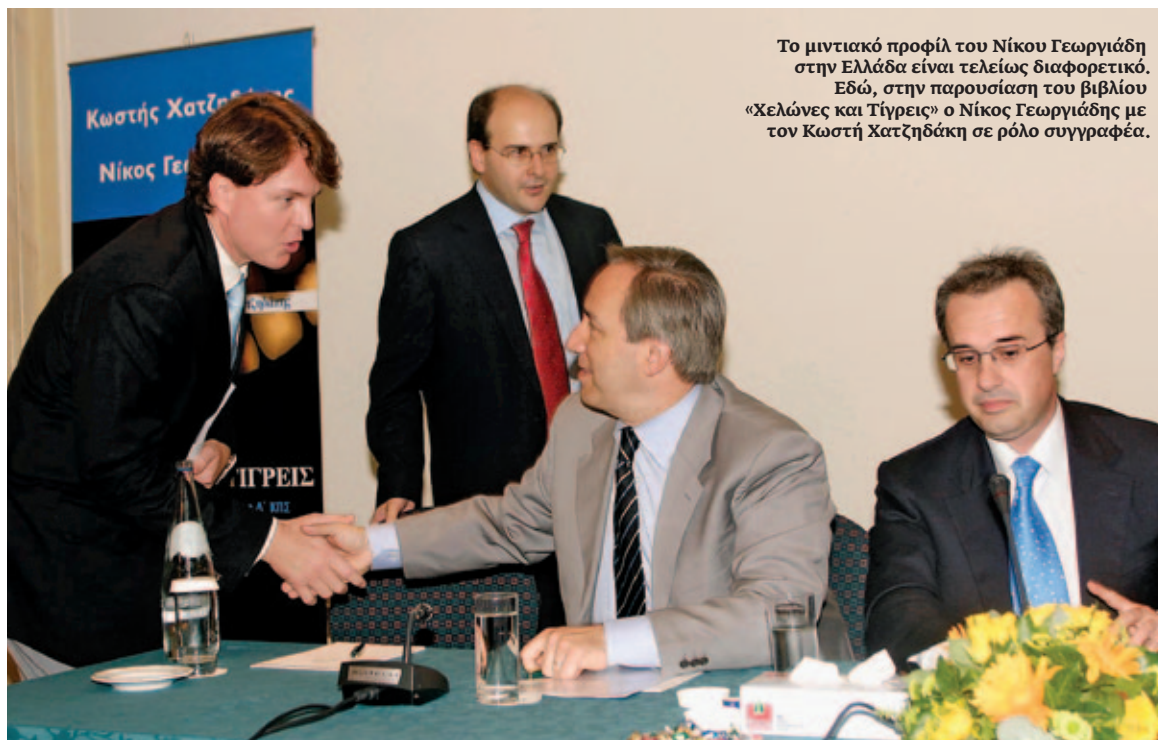
Το μιντιακό προφίλ του Νίκου Γεωργιάδη στην Ελλάδα είναι τελείως διαφορετικό. Εδώ, στην παρουσίαση του βιβλίου «Χελώνες και Τίγρεις» ο Νίκος Γεωργιάδης με τον Κωστή Χατζηδάκη σε ρόλο συγγραφέα.

Αστυνομίας στο φάκελο του Γεωργιάδη, τα οποία αποδείκνυαν τη σεξουαλική ασέλγεια του υπεύθυνου πολιτικού σχεδιασμού της Νέας Δημοκρατίας κατά ανήλικων αγοριών.